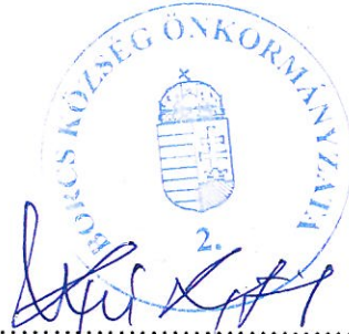
Ráczi Róbert polgármester