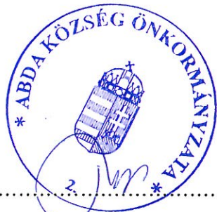
Szabó Zsolt polgármester

Több kérdés, hozzászólás nem lévén Szabó Zsolt polgármester megköszöni a részvételt és az együttes képviselő testületi ülést 20.19 órakor bezárja.