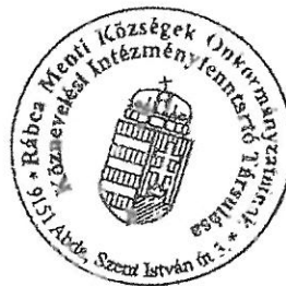
Szabó Zsolt Társulási Tanács elnöke

Az egységes szerkezetű Társulási Megállapodást a Társulási Tanács a 13/2020. (XI.3.) számú határozatával tudomásul vette.